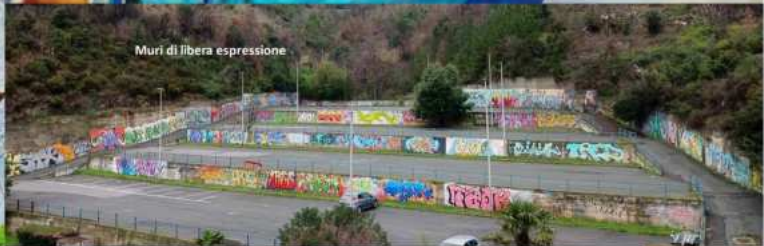
Muri di libera espressione