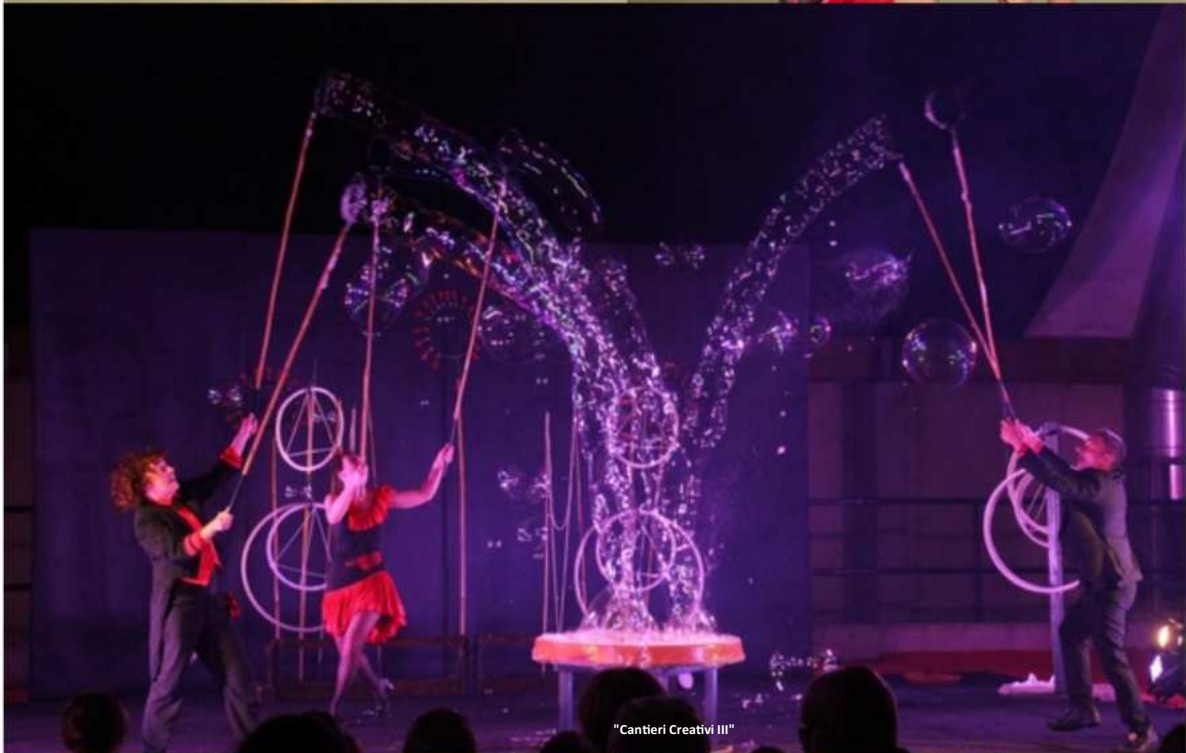
"Cantieri Creativi III"