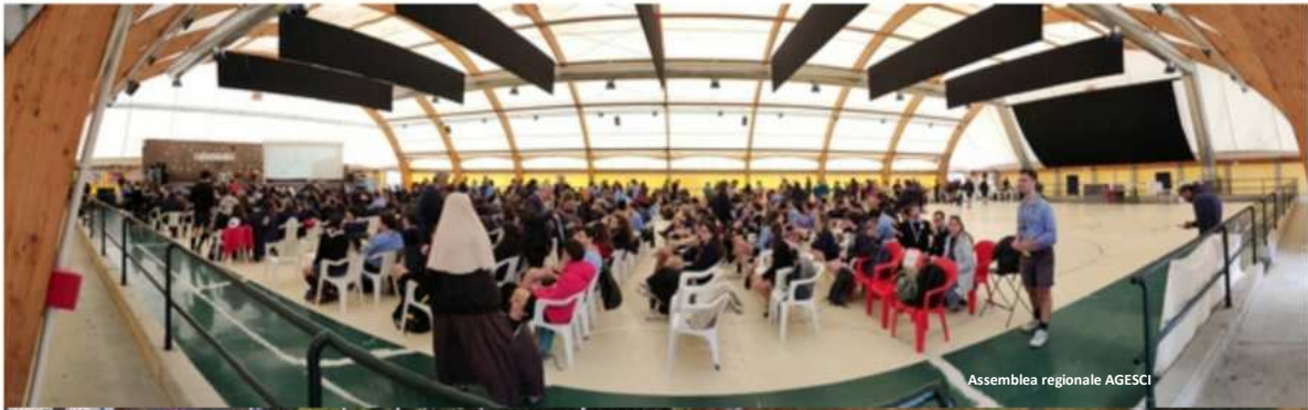
Assemblea regionale AGESCI